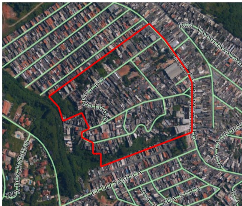
CROQUI DO NÚCLEO EM REGULARIZAÇÃO E CONFRONTANTE