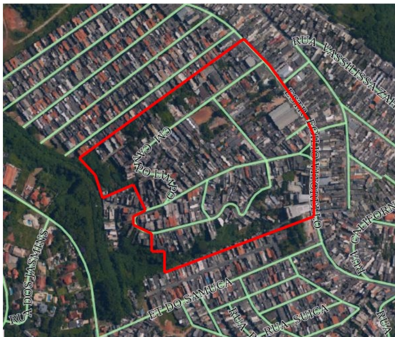
CROQUI DO NÚCLEO EM REGULARIZAÇÃO E CONFRONTANTE