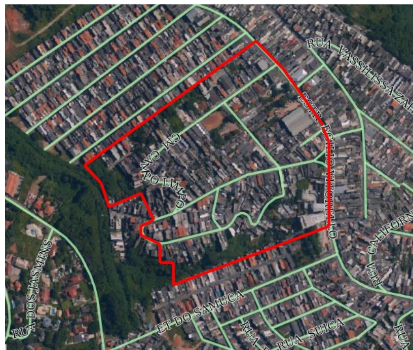
CROQUI DO NÚCLEO EM REGULARIZAÇÃO E CONFRONTANTE