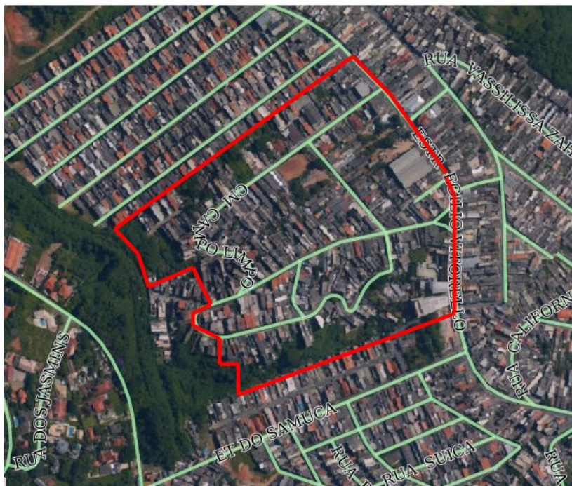
CROQUI DO NÚCLEO EM REGULARIZAÇÃO E CONFRONTANTE