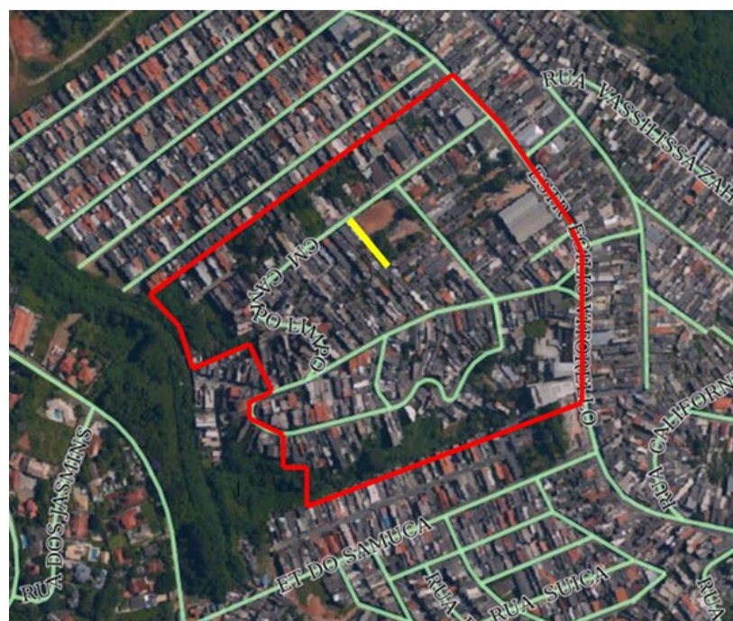
CROQUI DO NÚCLEO EM REGULARIZAÇÃO E CONFRONTANTE

Carapicuíba, 16 de Abril de 2026. À OLGA LENCE CALLAZ CPF/CNPJ.: 668.062.758-34 MATRÍCULA: nº 34.776 CRI CARAPICUÍBA Endereço de correspondência: ALAMEDA DOS GUAINUMBIS, N°476, PLANALTO PAULISTA, SÃO PAULO - SP CEP.: 04067-001