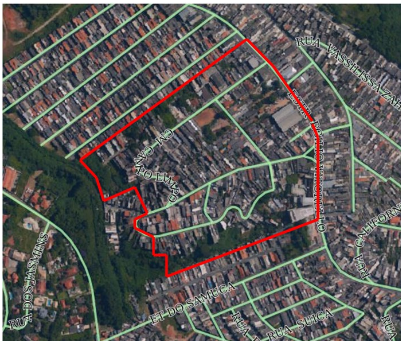
CROQUI DO NÚCLEO EM REGULARIZAÇÃO E CONFRONTANTE