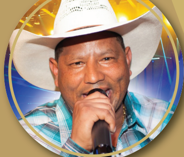
FÃ DOS TECLADOS