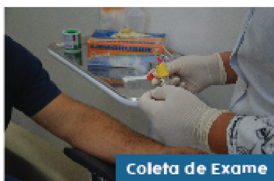
Coleta de Exame