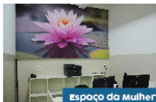
Espaço da Mulher