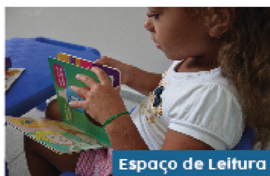
Espaço de Leitura